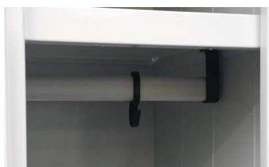
Appenderia interna in PVC